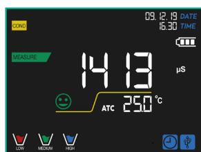
Pantalla LCD retroiluminada a color